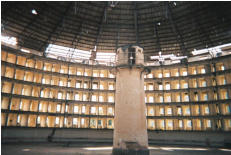
L'intérieur de la prison Presidio Modelo, à Cuba, construite sur le modèle du panoptique.

«L'inspection : voilà le principe unique, et pour établir l'ordre et pour le conserver ; mais une inspection d'un genre nouveau, qui frappe l'imagination plutôt que les sens, qui met des centaines d'hommes dans la dépendance d'un seul, en donnant à ce seul homme une sorte de présence universelle dans l'enceinte de son domaine» (Bentham, Panoptique , p. 12).