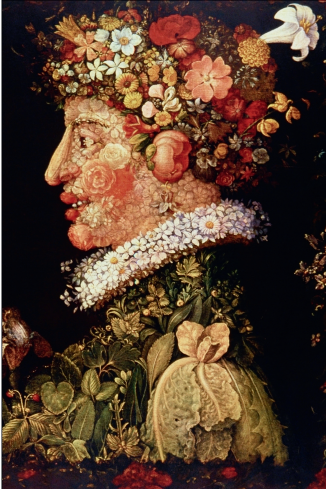
Fig. 2 : Le Printemps , Arcimboldo (1563).