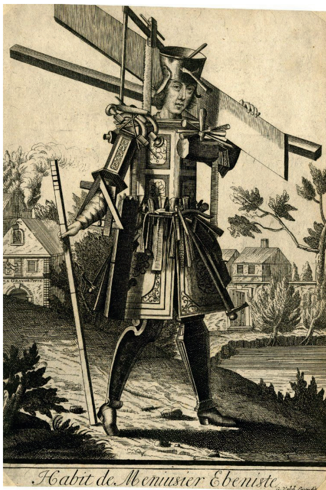
Habit de Menuisier Ebeniste